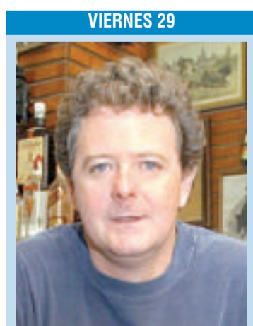
VIERNES 29 JUAN LUIS CANO ■ Miembro del dúo humorístico Gomaespuma. Periodista